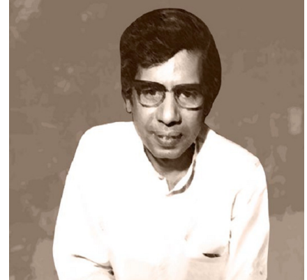
चित्र 15.3: फणीश्वरनाथ 'रेणु'