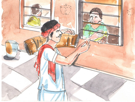
चित्र 15.3 : सिरचन उपहार देते हुए