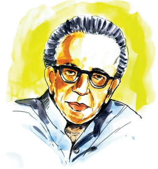
चित्र 5.3 : हरिवंशराय बच्चन

बच्चन जी ने अपनी रचनाओं में बेबाकी से अपने निजी जीवन का वर्णन किया है। 'क्या भूलूँ, क्या याद करूँ मैं' कविता हरिवंशराय 'बच्चन' की कृति 'निशा-निमंत्रण' से ली गई है। 1937-38 में लिखी इस रचना में कवि ने अपने जीवन के अनुभव को उजागर किया है। कवि की यह रचना भारतीय नारी के अस्तित्व को अपने संसार में विलीन कर देने का एक मार्मिक उदाहरण है। सन् 1936 में बच्चन जी की पत्नी श्यामा का निधन हो गया। कवि को अपनी पत्नी से अत्यधिक लगाव था और उनके निधन से बच्चन जी का जीवन अवसादों से घिर गया था। उन्होंने माना कि श्यामा के साथ वह भी कुछ मर गए और उनमें श्यामा भी कुछ जीती रहीं। यही हम सभी के जीवन का सत्य है कि यदि हमारा आत्मीय जन नहीं रहता है, तो हमारे अंदर भी कुछ मर जाता है और हमारी स्मृतियों में भी प्रिय जीवित रहता है।