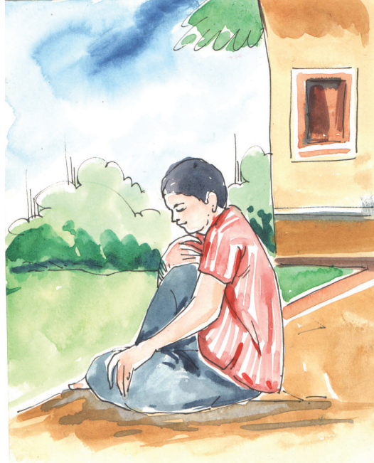
चित्र 5.3 : एक दुखी व्यक्ति

व्याख्या— आप इस बात से सहमत होंगे कि आँसू प्रत्येक व्यक्ति के जीवन के सच्चे साथी होते हैं, क्योंकि ये हर समय साथ देते हैं— चाहे सुख का समय हो या दुख का। हमारे जीवन में हमारा प्रिय या संबंधी यदि हमारे पास नहीं होता, तो उसके साथ बिताए गए अच्छे समय की यादें भी आँखों में आँसू ले आती हैं। ये आँसू खुशी के होने के साथ-साथ दुख भी लिए हुए होते हैं। कवि बच्चन ने इसी मनोभाव को स्पष्ट करते हुए कहा है कि सुख में बीते हुए समय को याद करके भी व्यक्ति की आँखों में आँसू आ जाते हैं, क्योंकि उसे ऐसा लगता है कि जो खुशी के पल बीत चुके हैं वे अब दोबारा वापस नहीं आ सकते। सुख के बीते पलों के साथ दुख के वर्तमान दिनों को जोड़ देने