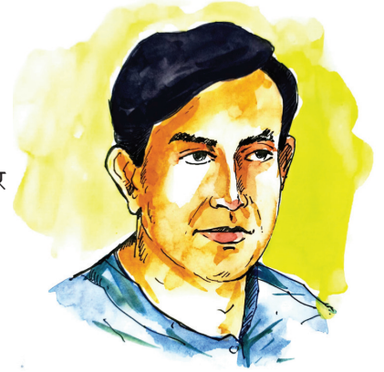
चित्र 5.1 : रामधारी सिंह दिनकर

वैराग्य छोड़ बाँहों की विभा सँभालो, चट्टानों की छाती से दूध निकालो। है रुकी जहाँ भी धार, शिलाएँ तोड़ो, पीयूष चंद्रमाओं को पकड़ निचोड़ो।